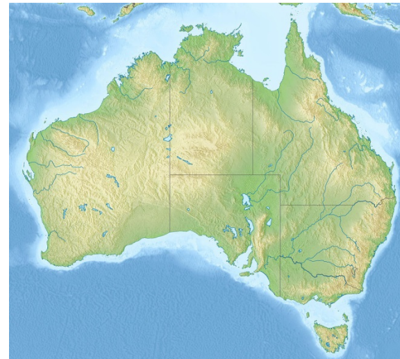
Australia relief map, von Виктор В, Lizenziert unter CC BY-SA 3.0, https://de.wikipedia.org/wiki/Australien#/media/File:Australia_relief_map.jpg